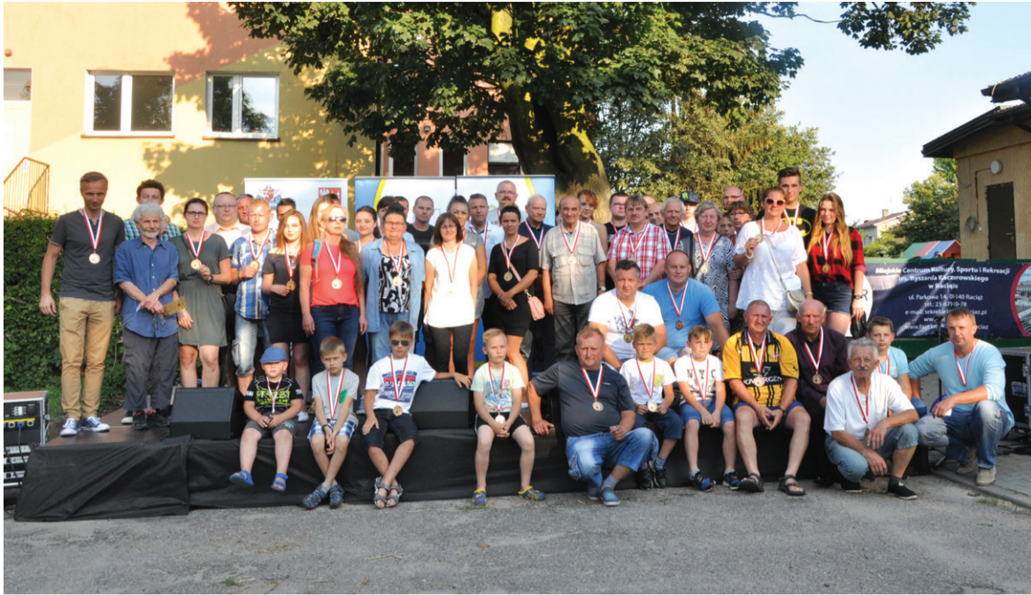
I Raciąski Rajd Rowerowy