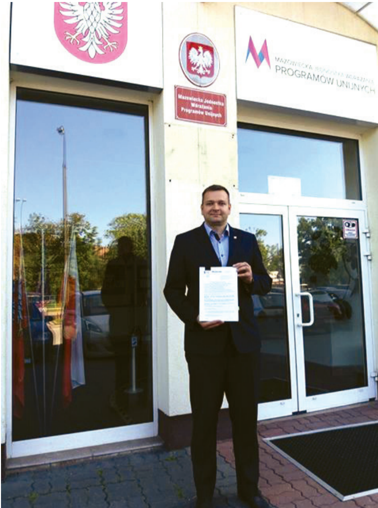
Gmina pozyskała prawie 2 mln zł dofinansowania