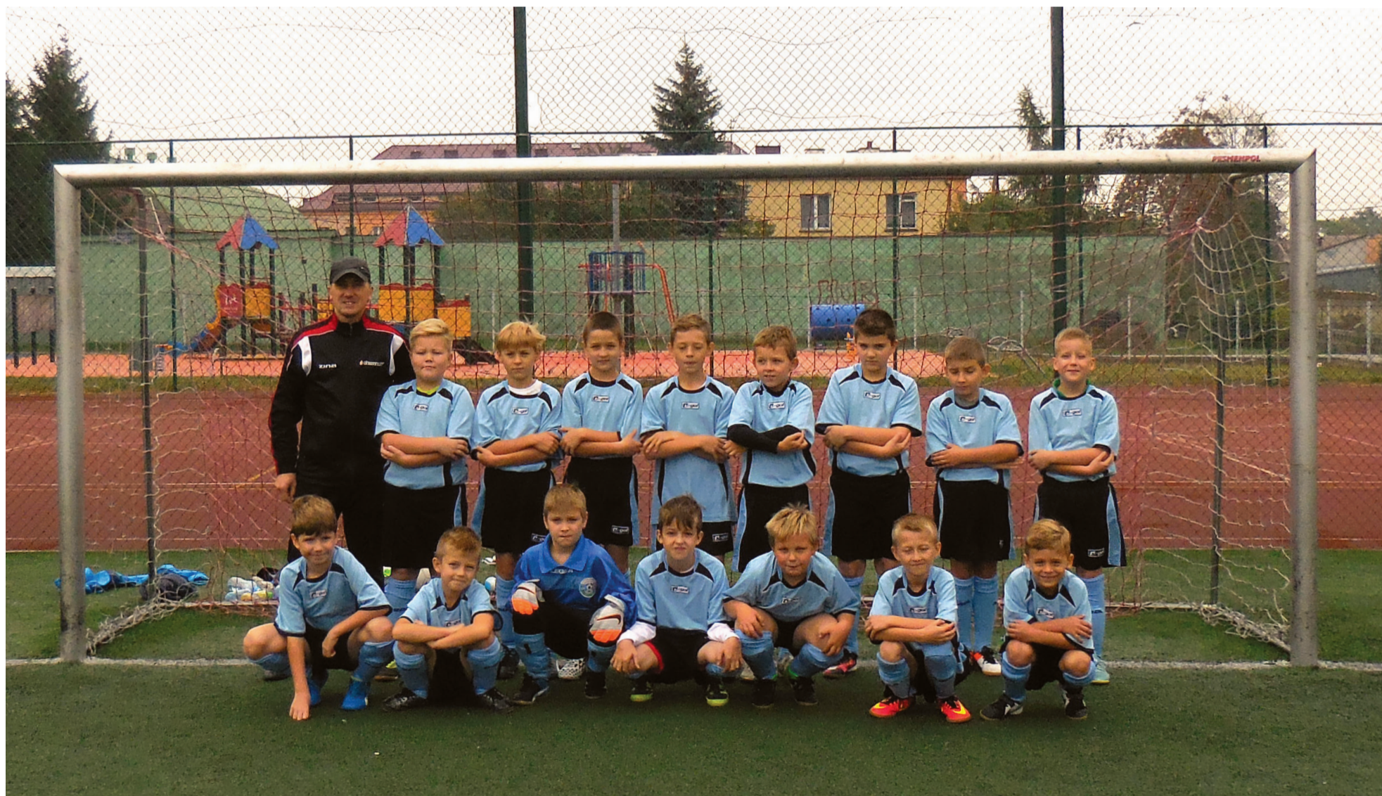
GKS ORLĘTA BABOSZEWO