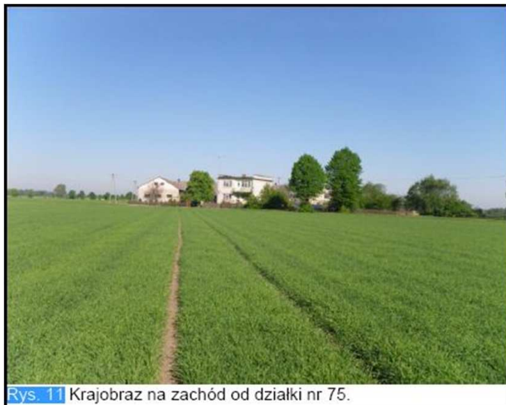
Rys. 11 Krajobraz na zachód od działki nr 75.