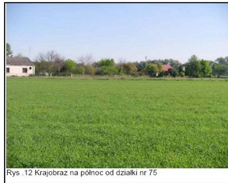
Rys. 12 Krajobraz na północ od działki nr 75